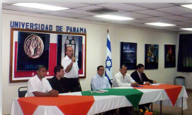
Palabras por el Embajador de Israel en el Acto de Inauguración de Exposición de Fotos "Israel Vibrante". Jun. 2007