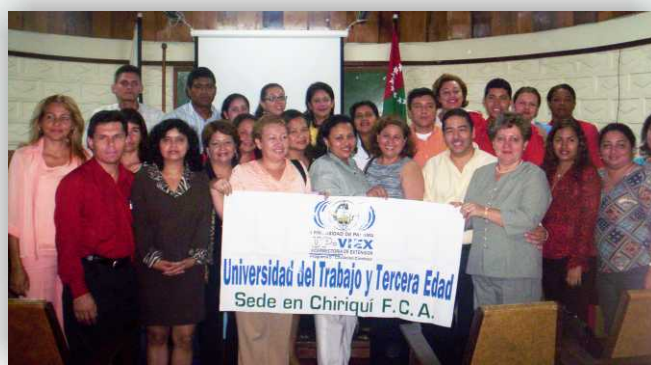
Grupo del Diplomado en Salud Sexual Reproductiva.