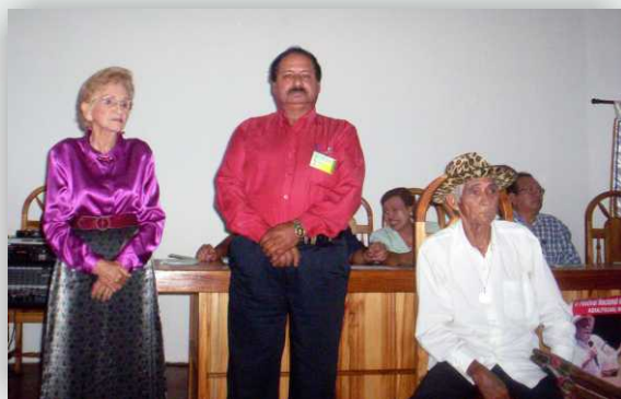
Concurso de canto.

Entre las otras actividades que desarrollaron, se encuentra la participación en la Feria Internacional de David, la Exposición de fotos Israel Vibrante, Concursos de Canto Caminata y visita al asilo Santa Catalina.