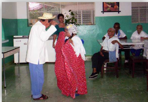
Presentaciones típicas de la tercera edad, celebradas en el Asilo Santa Catalina.